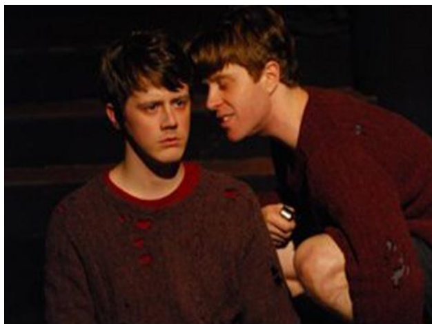
LE GRAND CAHIER, Groupe Bec-de-lièvre